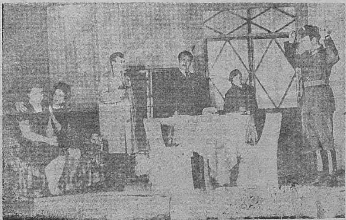
Сцена от пиесата „Тревога“ на Орлин Василев, с която театралният колектив стана лауреат на II Републикански фестивал и носител на бронзов медал.