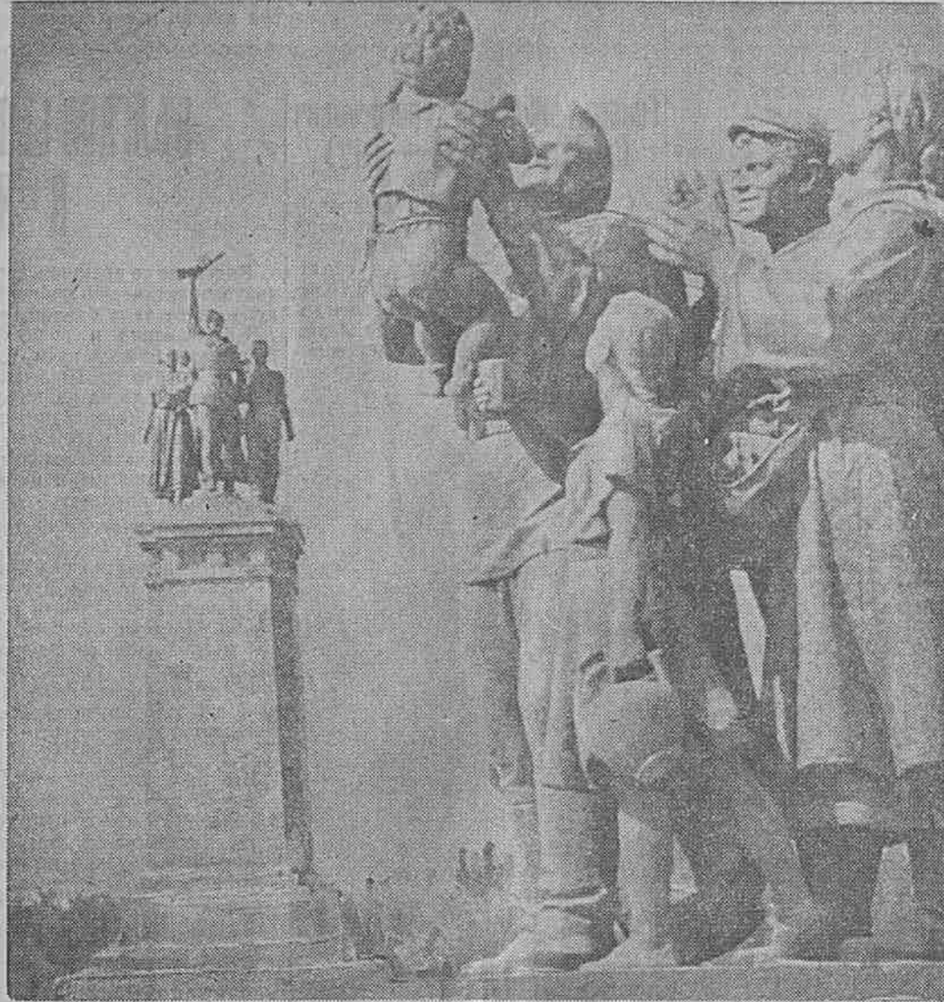
Фрагмент от паметника на Съветската армия в София

(Из речта на връх „Столетов“ по случай 80-годишнината на Шипченските боеве)