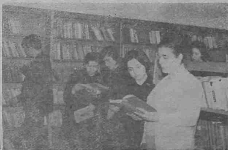
В библиотеката е винаги оживено

След събаряне на джамийското помещение и оформянето на днешното парче, библиотеката е преместена на ул. „Баучер“ № 1. Само след една година беше ос-