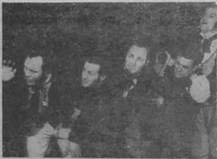
Сцена от „Женитба“

„Гукии ми, гукии, гугутке“ — една песен, която събира в сградата на старото читалище младежи и девойки, които поставят началото на танцовия колектив при читалище „Дружба“ 1947 година може да се счита за рождена, защото тогава се поставят основите на организиран и осмислен живот на танцовото изкуство.