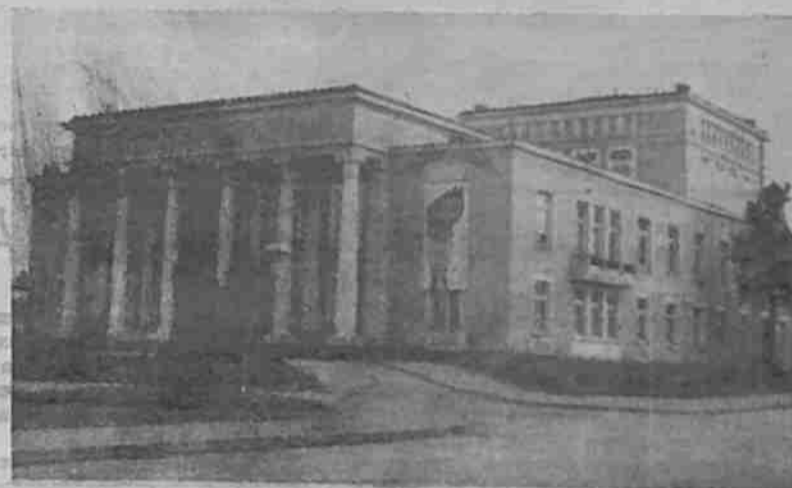
Новата читалищна сграда

Да ни е честит 100-годишният юбилей! Да пребъде благородното и патриотично дело на народното ни читалище „Дружба“-столетник!