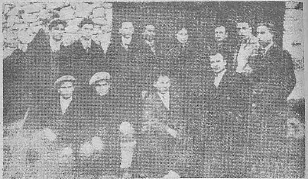
На сбора в с. Черепово — учители профопозиционери