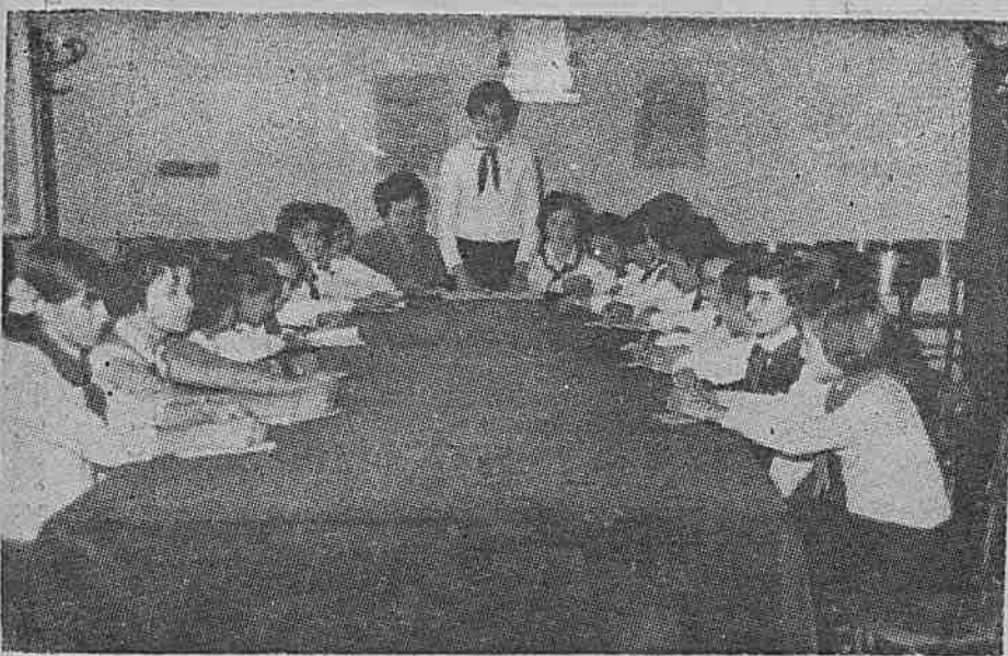
Дружинният съвет обсъжда новият план