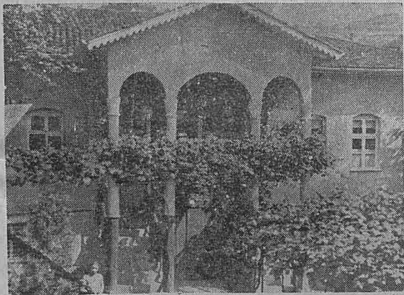
Първото светско училище в района. В една от класните му стаи през 1862 г. се поставят основите на народното читалище.

В историята на народите има дати, които с векове се помнят, дати които бележат нови епохи, откриват светли страници за един прекъсен живот. Такава дата за нашето селище е 1862 г., когато за първи път заблестява в мрака на петаковното турско робство искрата на народната пробуда — читалището.