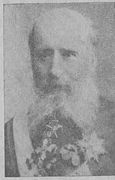
Проф. Марин Дринов