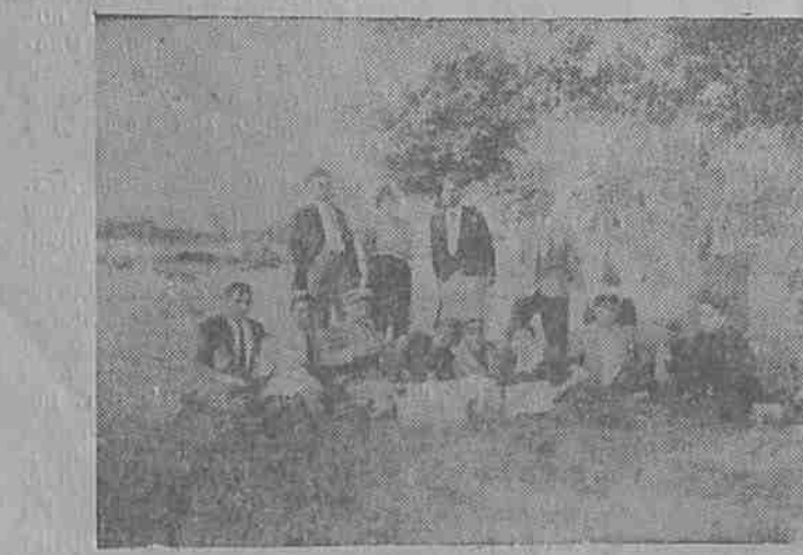
Група ремсници от Елена — 1929 година

отново излякохме на Блъсковското шосе. През „Енчовци“ се насочихме към „Стаяна сирена“. Сбирката трябва да се проведе на тази местност, защото от там имаше видимост по всички посо-