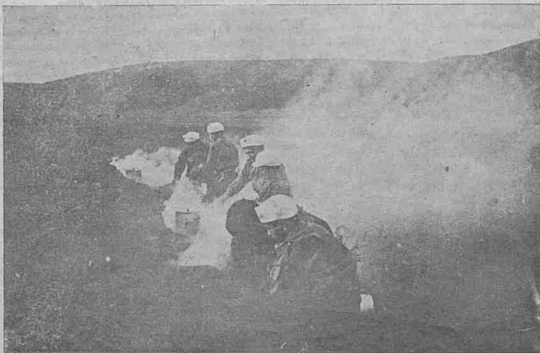
Գարակեօզեան Որբանոցի սկաուտները կերակուր պատրաստութեան ատեն

նէին հանքի աշխատանքը և արտածումը: Վերջը տեղի ունեցաւ բանուորներու ազատագրութիւնը: