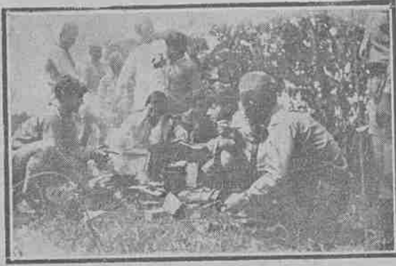
Ատանայի սկսուածները ճաշի միջոցին