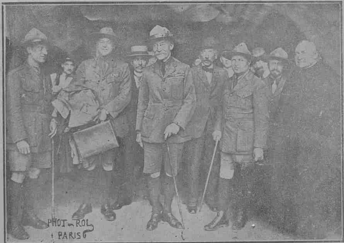
LE GÉNÉRAL BADEN-POWEL, LE GRAND CHEF DU SCOUTISME VIENT VISITER LES CAMPS DES BOY-SCOUTS FRANÇAIS.

Անս երկու գործեր որ կ'ուզենք անենքն առաջ տպոս սոլորսիսն դարձնել: Ասիկա խաբոխսն է մեր ԳՈՐԾԻՆ և սկիզբը բոլոր յասկուրիսնեանս: ՊԷՏԵՆ ԲԱՌՔԸԼ