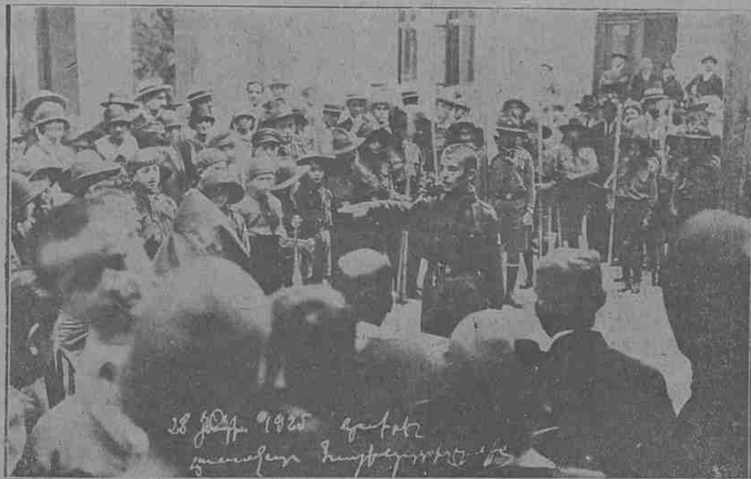
(“ՊԱՏԻՈՅՍ ՎՐԱՅ ԿԵՐԴՆՈՒՄ, ԱՐՏԱՍԱՆԱԾ ՄԻՋՈՑԻՆ) Հ. Մ. Ը. Մ.ի ներկնականու երգական առարողութիւնը Պուլքեօի մէջ

Յօդուածներու, րդրակցութեան, խոր- բագրական այլ գրութիւններու եւ քեր- քեռու, ինչպէս նաեւ գրամի առաւելան ու վարչական այլ գործերու համար հասցի: